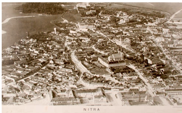
Letecký záber na Nitru z r. 1933

v ženskom rode. Nie je to však výlučne len v prípade samohlások, ale stáva sa to aj pri zakončení na spoluhlásku, ako napr. pri slove papuc > papuča. Slovo Tabáň je poslovenčením pôvodného taban, nemá však koncové a, teda malo by byť mužského rodu, lenže... mnoho Nitranov hovorí o tej Tabáni. Možno by sme v tomto prípade mali rešpektovať nitriansky dialekt.